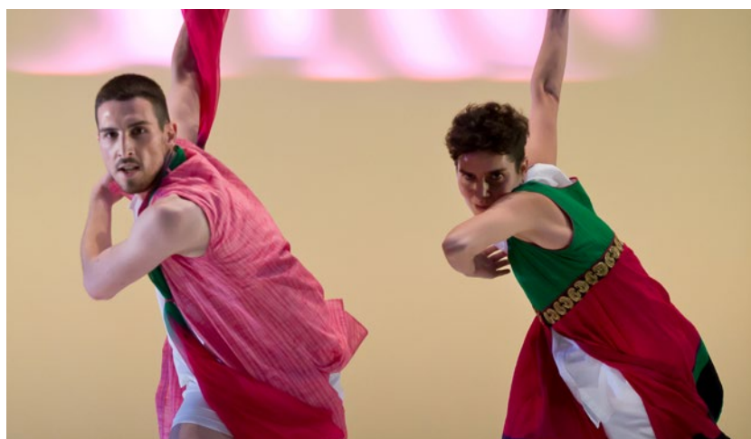
© CCNT - Thomas Lebrun « Dans ce monde »

Depuis 2015, le bureau d'accompagnement d'artistes La Belle Orange accompagne 7 chorégraphes basés en Région Centre-Val de Loire. Il mène et coordonne des ateliers en collège, école