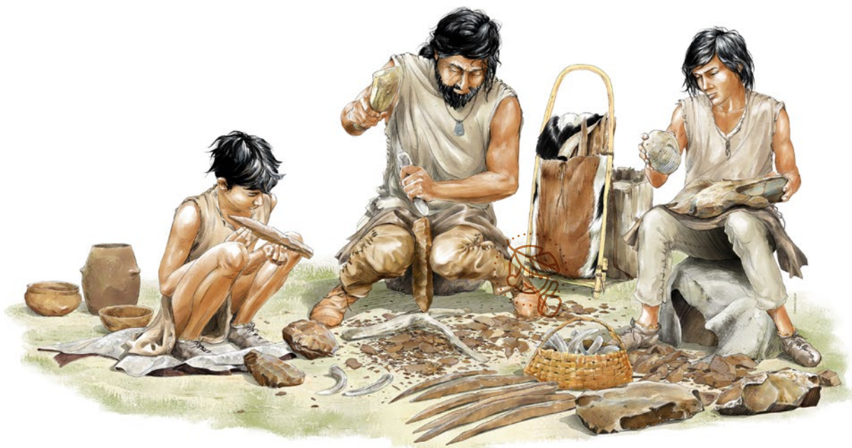
Un maître tailleur de silex du Grand-Pressigny et ses deux apprentis, vers 2500 avant J.-C. - Illustration : © F. Liéval

Possibilité de visiter un chantier de fouilles mené par le service archéologique d'Indre-et-Loire en fonction de l'actualité.