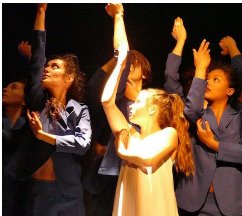
© arboredanse - La Cief- A propose de Barbe Bleue

Contact : Blandine Malterre, Conseillère Pédagogique Départementale EPS 02 47 70 19 15 blandise.malterre@ac-orleans-tours.fr ; USEP 37, 02 47 20 40 21 usep37@fof37.org