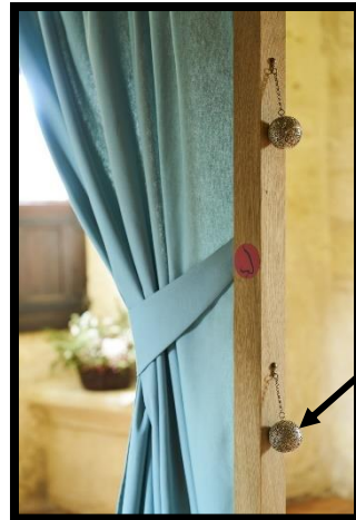
La pomme de senteur ou pomander

Voici le nez de Pierre de Ronsard. Il indique une odeur à sentir.