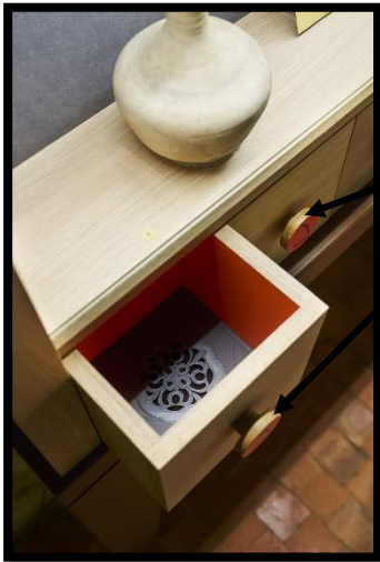
Salle Renaissance, rez-de-chaussée

Le parcours olfactif. Il commence au rez-de-chaussée du logis du prieur. Il continue à l'étage, dans la chambre de Ronsard.