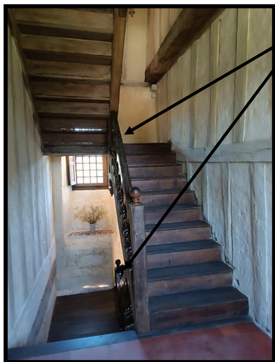
Escalier rampe sur rampe - milieu du 17 e s.

Une rampe est présente sur l'ensemble des escaliers.