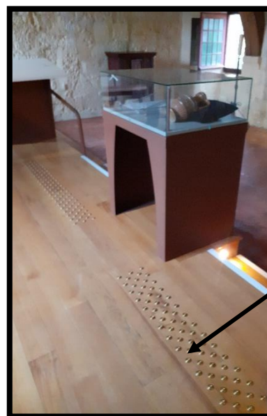
Salle Renaissance, rez-de-chaussée