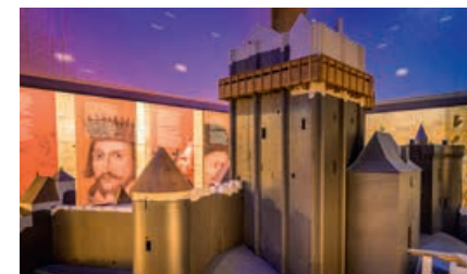
La Tour neuve : de nouveaux espaces scénographiques à découvrir !

Inventez votre visite ! VISITE PARTICIPATIVE (ados)